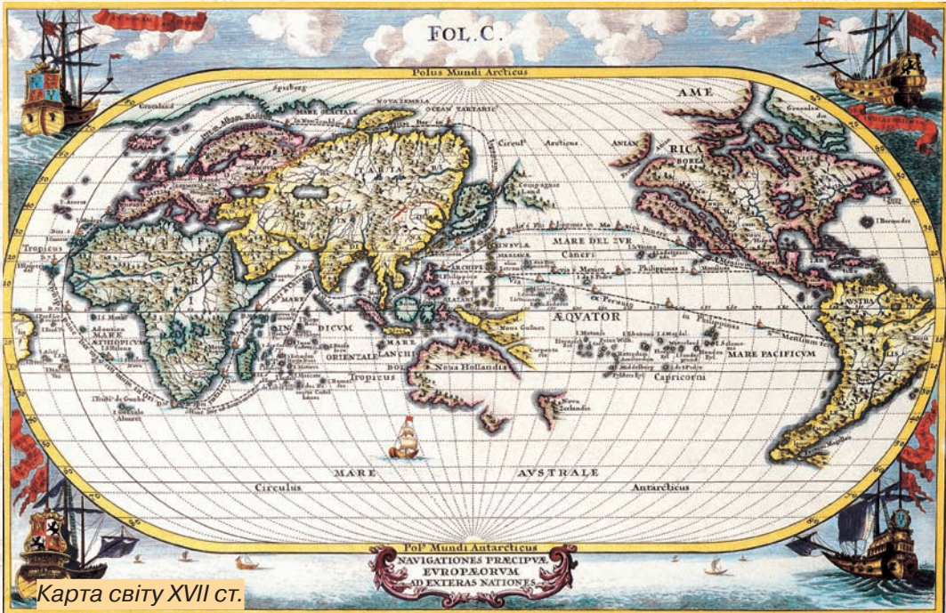
Карта світу XVII ст.

Астроніміка (від гр. (астро) «зоря» + «ім'я») — вивчає власні імена небесних тіл: назви зірок, планет, комет, астероїдів тощо.