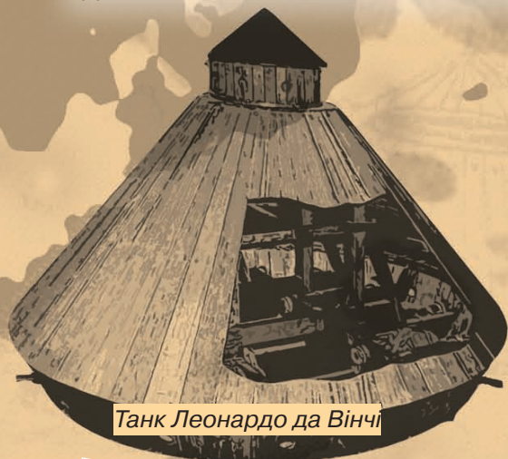
Танк Леонардо да Вінчі

Одним із перших, хто здійснив спробу сконструювати машину, яка б максимально захищала екіпаж від вогнепальної зброї, був геніальний італійський учений, художник і винахідник Леонардо да Вінчі.